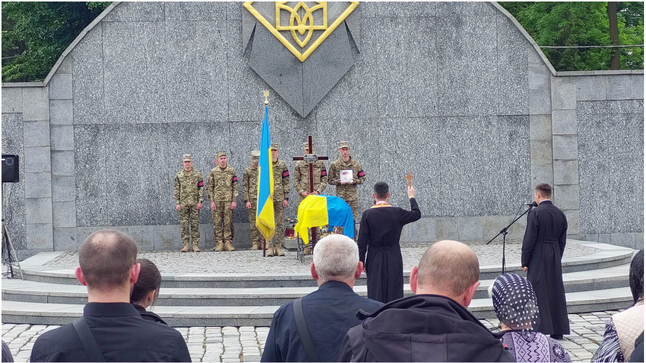
Pogrzeb wojskowy żołnierza poległego za wolność Ukrainy...