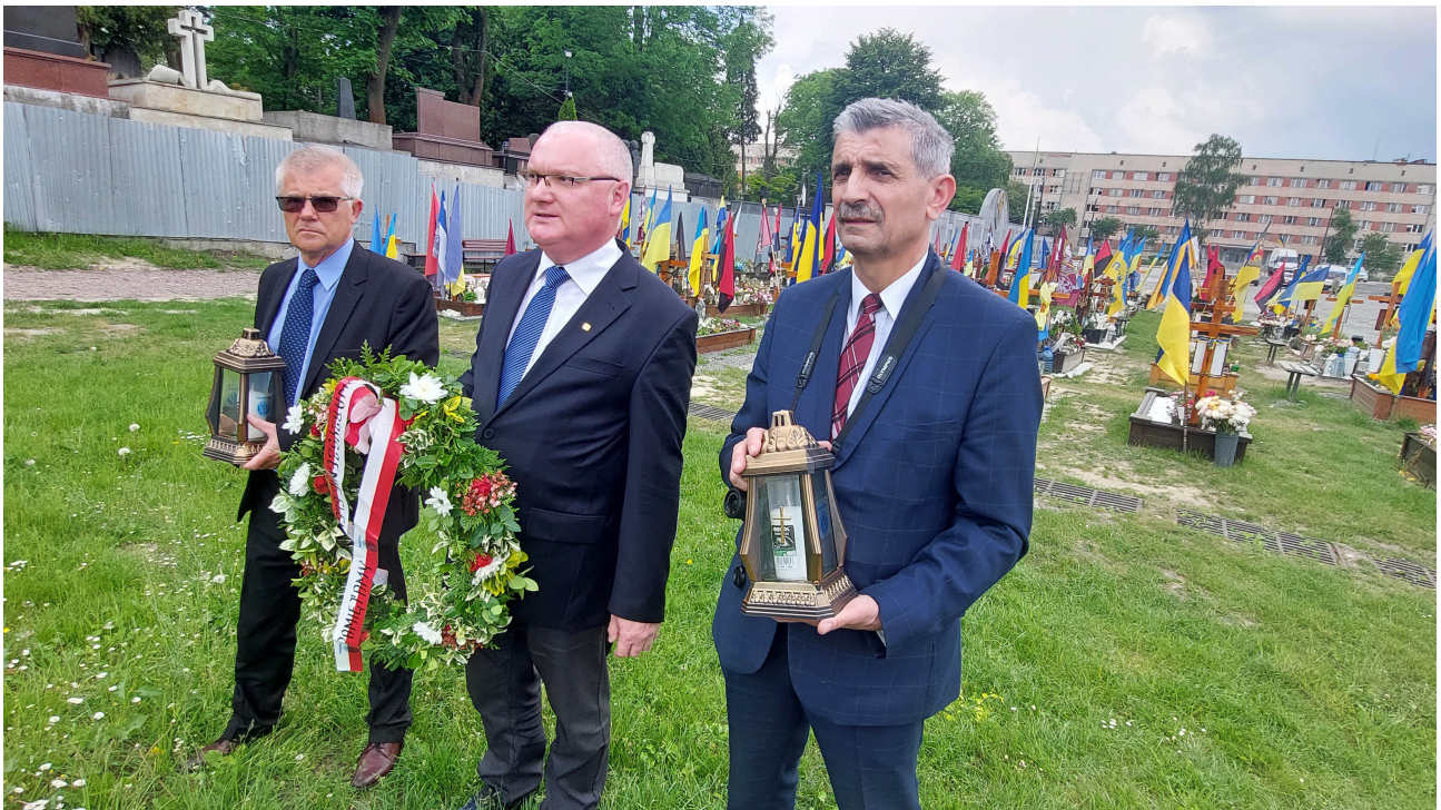
Delegacja SEP podczas składania kwiatów i zniczy na cmentarzu żołnierzy poległych w latach 2022-2023