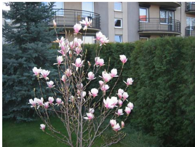
Rys.3 Magnolia z poprzedniego Infosepika w pięć dni później