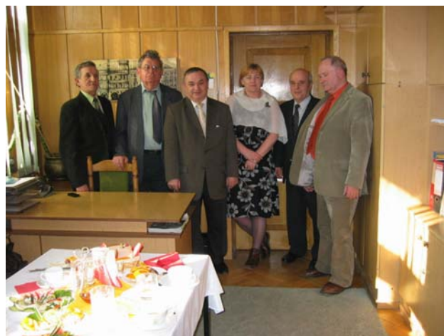
Fot. 9. Spotkanie w Oddziale Chełmskim SEP

Spotkanie było znakomitą okazją do zapoznania się ze specyfiką działalności małego Oddziału SEP zrzeszającego ok. 130 członków.