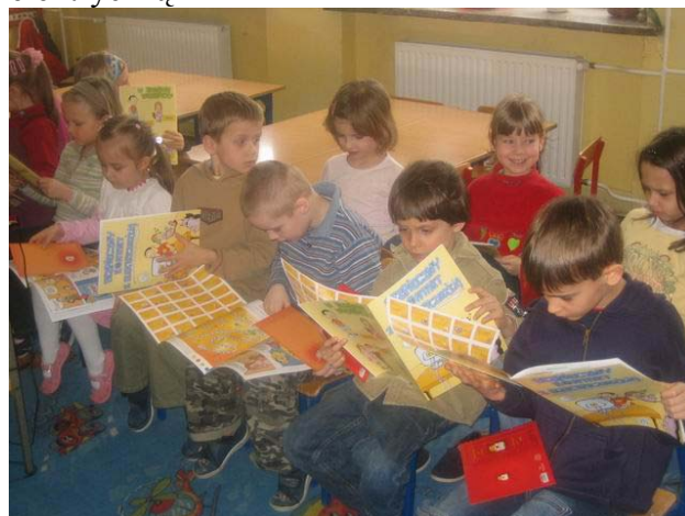
Fot. 8. Dzieci z zainteresowaniem czytają komiksy wydane przez SEP

podstawowych zagrożeń związanych z energią elektryczną