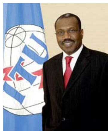
Fot. 6. Sekretarz Generalny ITU dr Hamadoun I. Touré

Na stronie internetowej Międzynarodowej Unii Telekomunikacyjnej (ITU) ukazało się przesłanie sekretarza generalnego dr. Hamadouna I. Touré'a wydane z okazji Międzynarodowego Dnia Telekomunikacji i Społeczeństwa Informacyjnego.