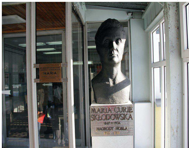
Fot. 2. Popiersie Marii Skłodowskiej-Curie przed wejściem do budynku reaktora Maria.

Głównym punktem wycieczki było zwiedzanie reaktora „Maria” oraz Laboratorium Badań Materiałowych.