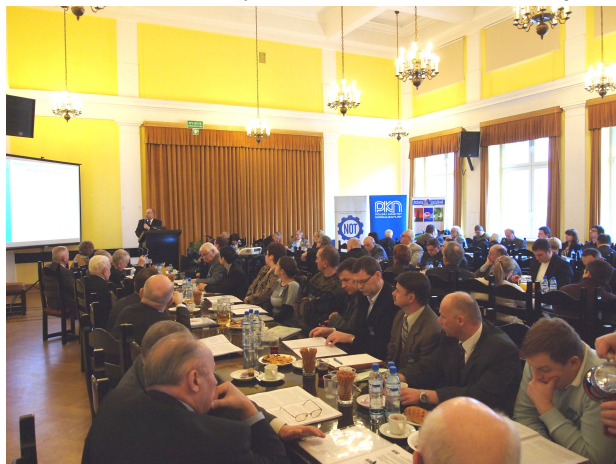
Fot. 3. Sala obrad.

W dniu 1 lutego 2012 r. w sali B Warszawskiego Domu Technika odbyło się I Europejskie Forum Normalizacyjne „Korzyści wynikające z normalizacji w dziedzinie bezpieczeństwa”, zorganizowane przez Komitet Naukowo- Techniczny FSNT NOT ds. Normalizacji.