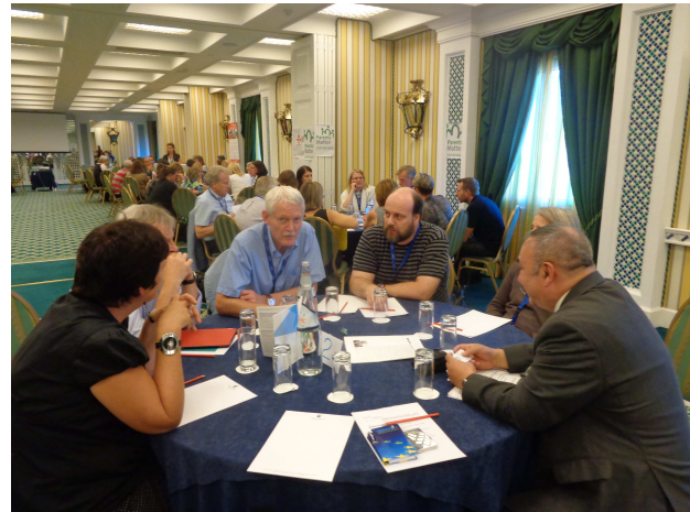
Fot. 3. Dyskusja nad wynikami projektu ELEVET podczas sesji „Round Table”.