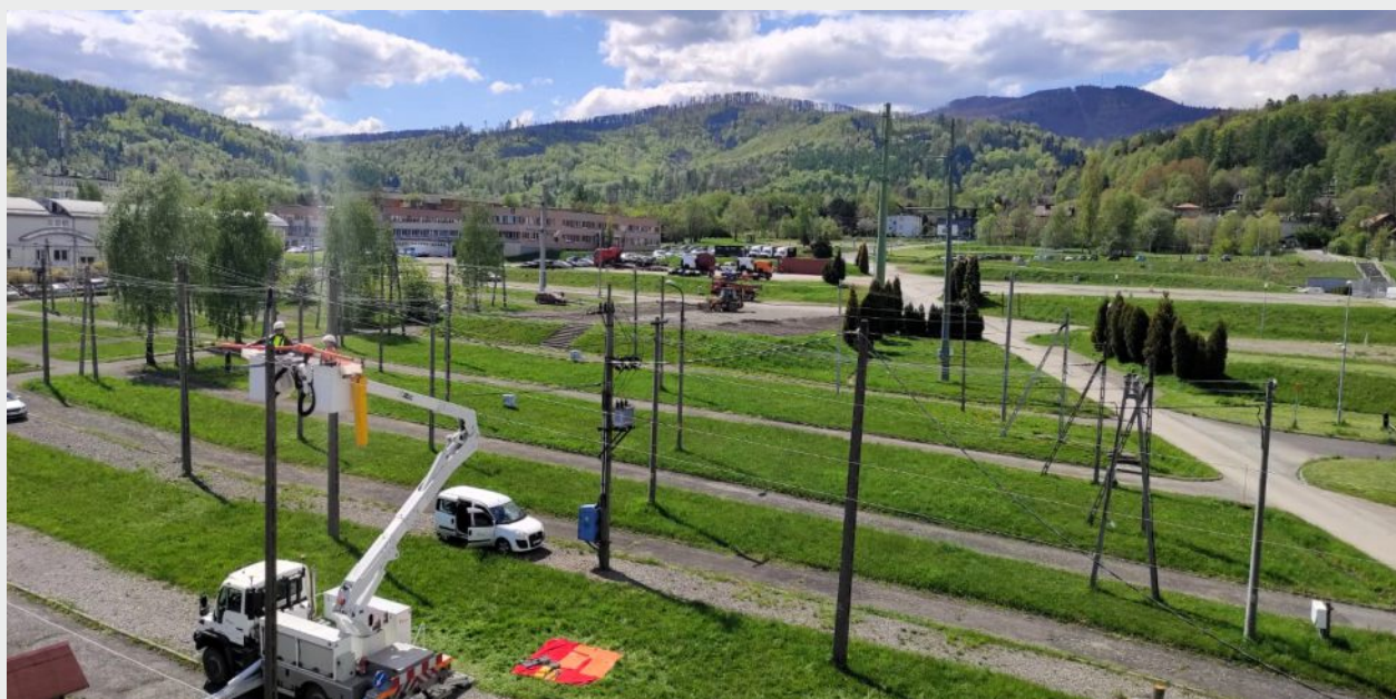
Poligon szkoleniowy zewnętrzny