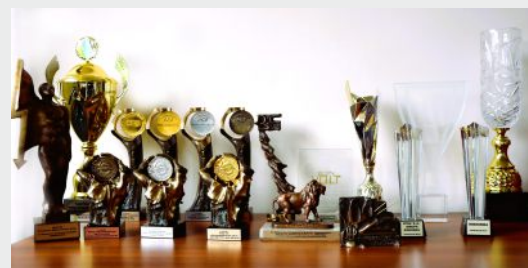
Nagrody w konkursie targowym