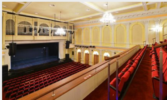
Bielskie Centrum Kultury