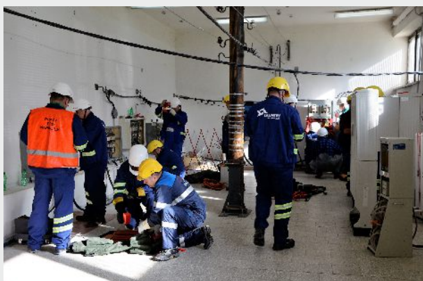
Poligon szkoleniowy wewnętrzny