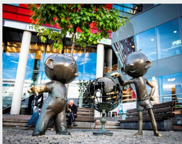
Bajkowe miasto - figurki Bolka i Lolka