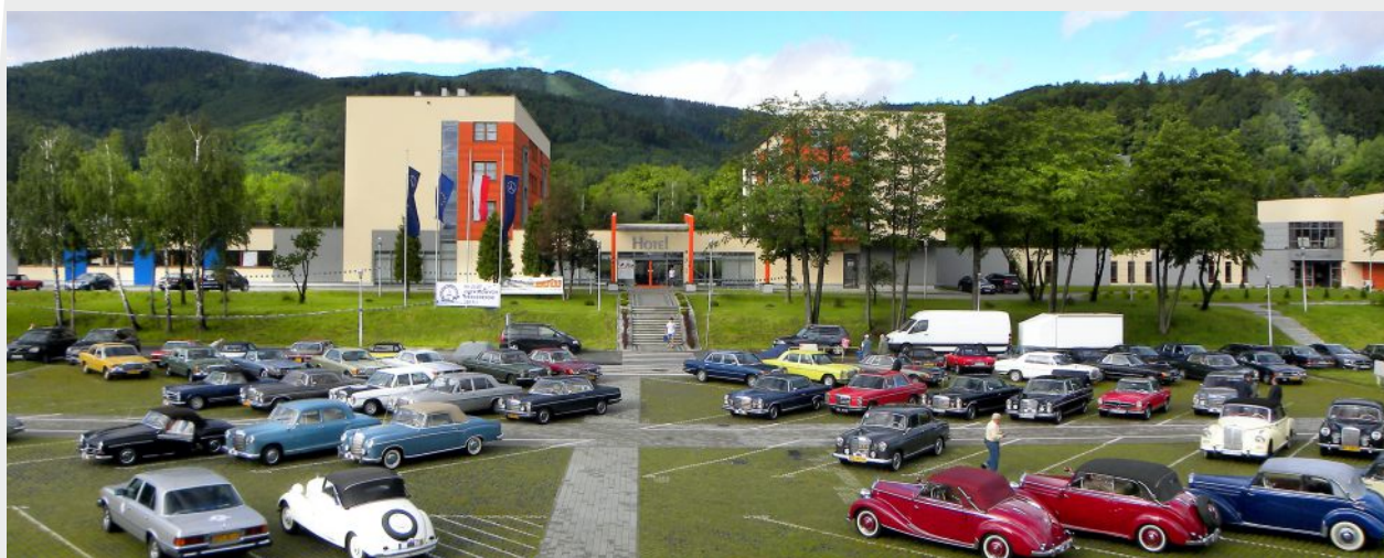
Impreza masowa - Złot zabytkowych Mercedesów