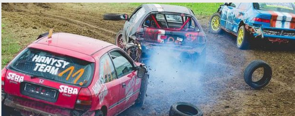
Impreza masowa - Moto Shaw