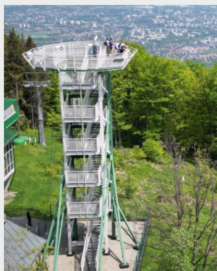
Wieża widokowa na Szyndzielni