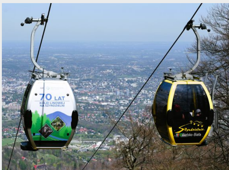
Gondole Kolei Linowej Szyndzielnia