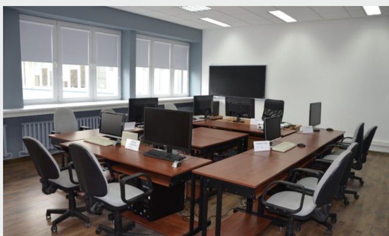
Sala szkoleniowa - komputerowa