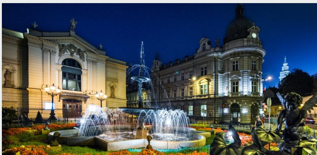
Teatr Polski, Poczta Polska i Katedra św. Mikołaja