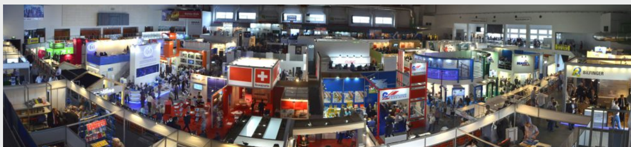
Panorama w hali A