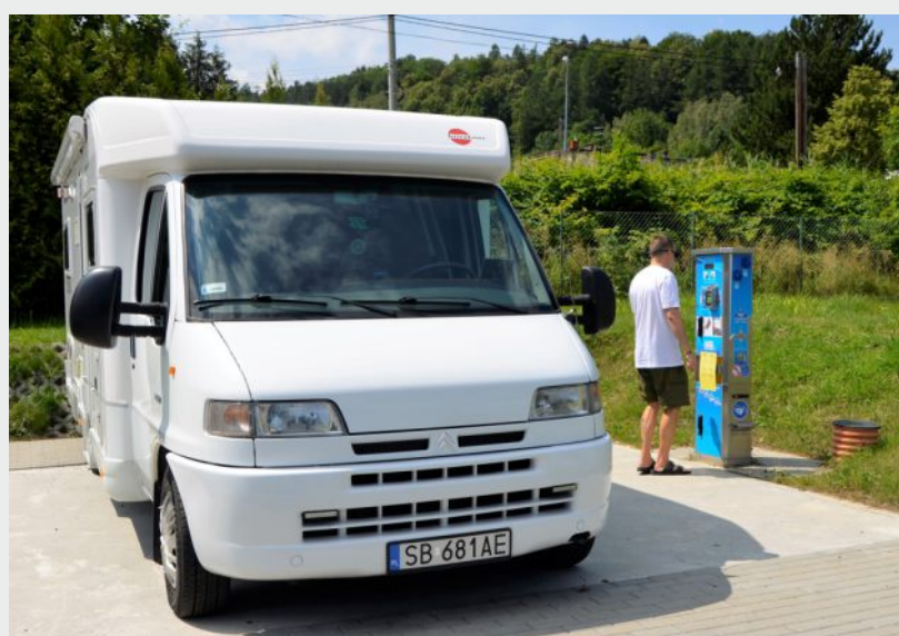
Camper Park przy hotelu