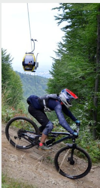
Trasa rowerowa Enduro-Trails