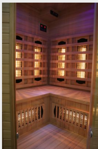
Sauna na podczerwień