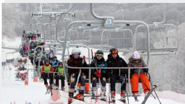
Kolej Linowa Dębowiec