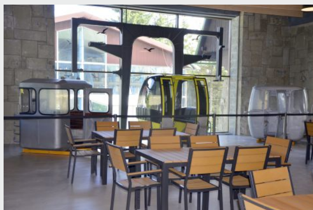
Ekspozycja historycznych wagoników w Starej Stacji