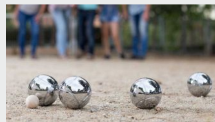
Boisko do gry w boule