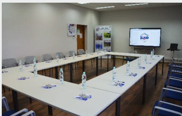
Sala szkoleniowa w budynku biurowca ZIAD