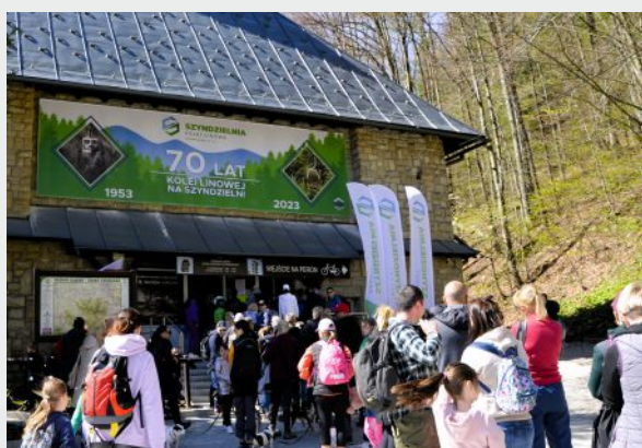
Dolna stacja Kolei Linowej Szyndzielnia