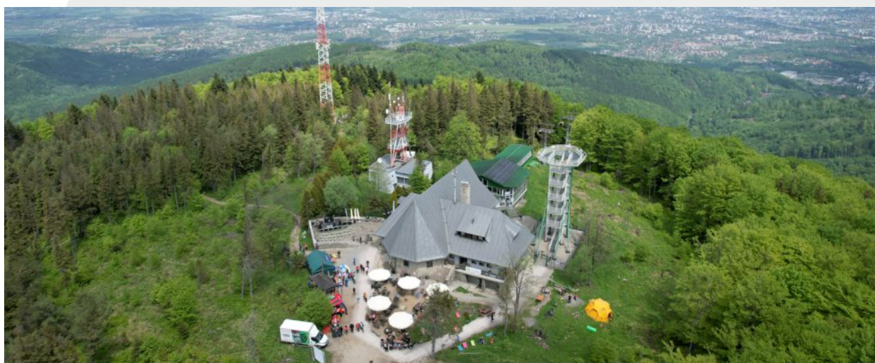
Widok na górną stację Kolei Linowej Szynkielnia