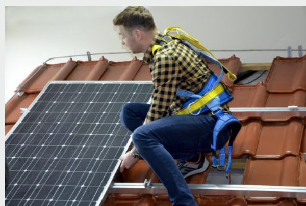
Kurs montażu paneli fotowoltaicznych