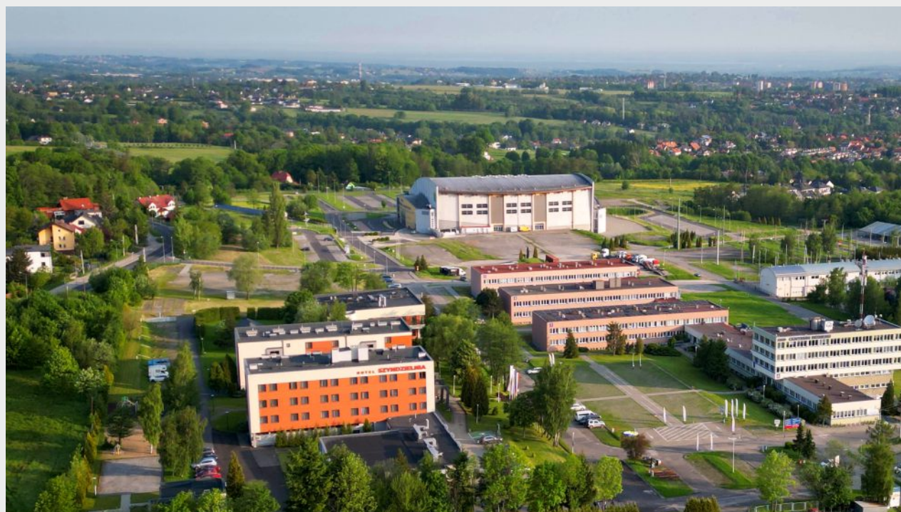
Widok z lotu ptaka na ZIAD Bielsko-Biała SA