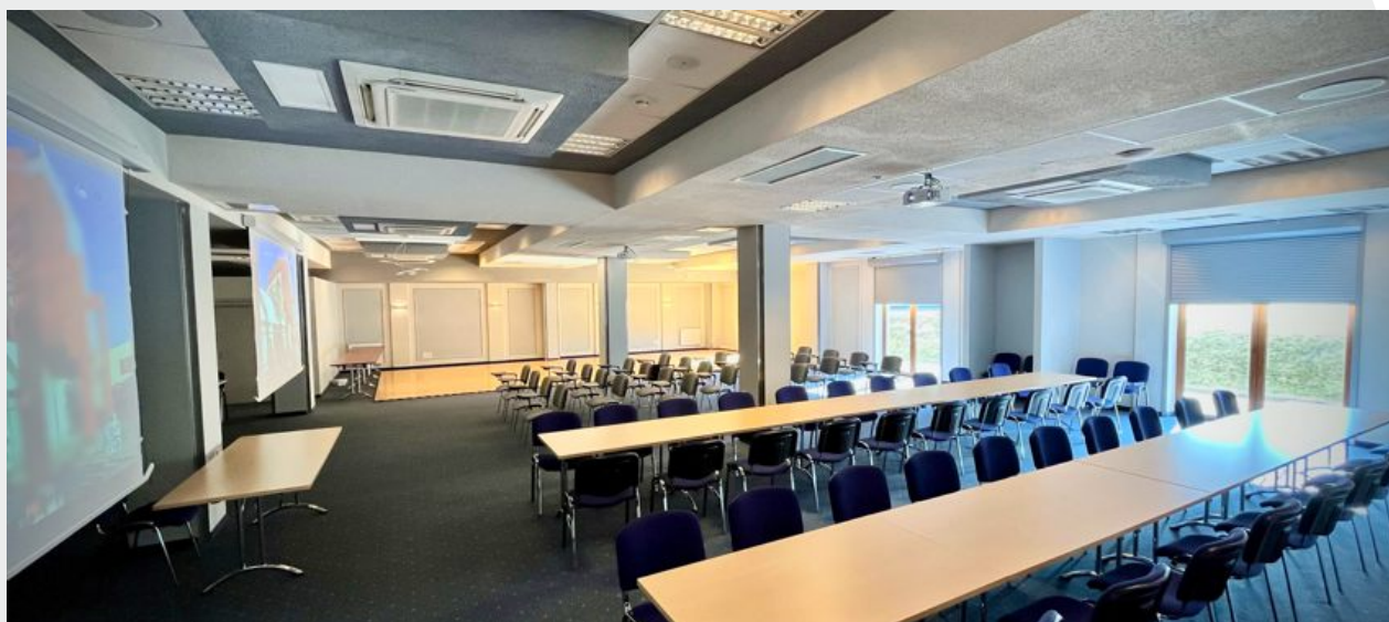
Największa sala konferencyjna Lazurytowa