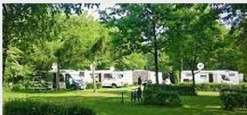
Camping pod Dębowcem