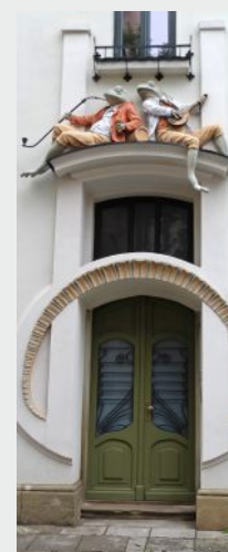
Kamienica pod żabami