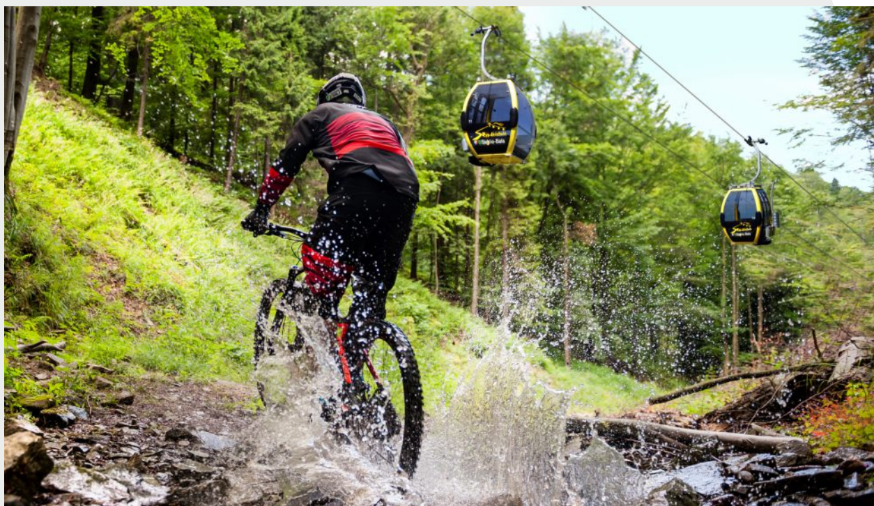
Trasa rowerowa Enduro Trails