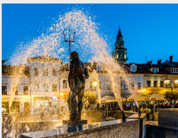
Posąg Neptuna na Starym Rynku