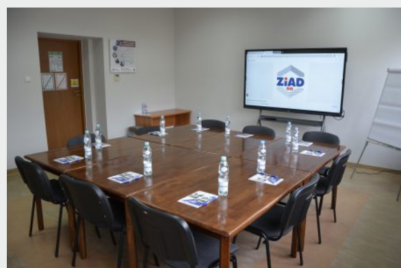
Sala szkoleniowa w budynku biurowca ZIAD