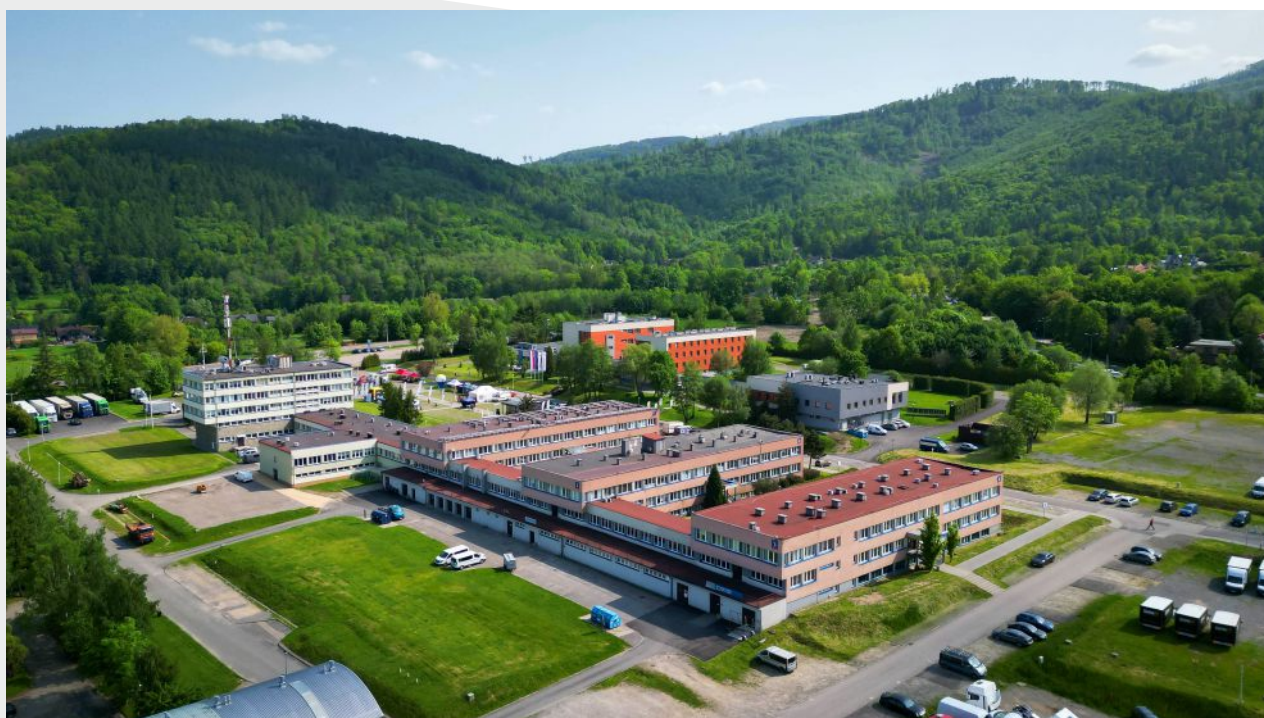
Widok z lotu ptaka na ZIAD Bielsko-Biała SA