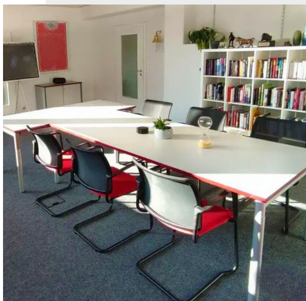
Przykładowe pomieszczenie na wynajem