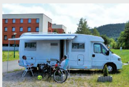
Camper Park przy Hotelu Szynkielnia