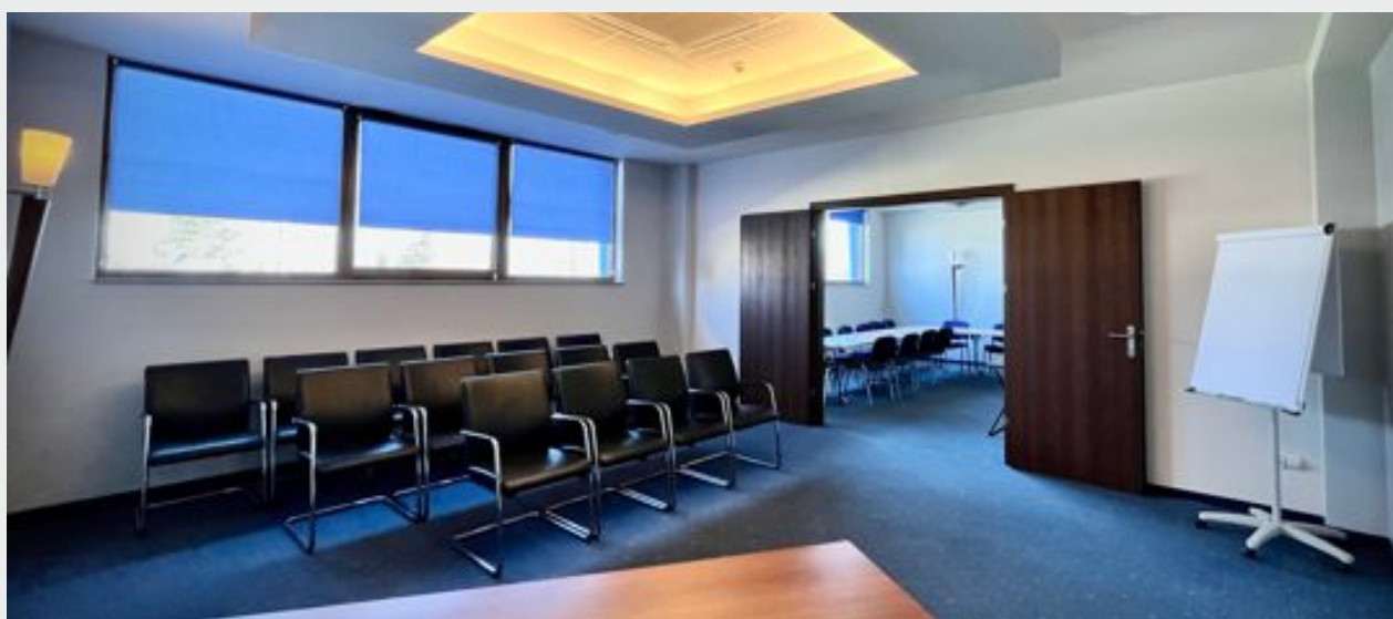
Sale konferencyjne Szafirowa i Turkusowa